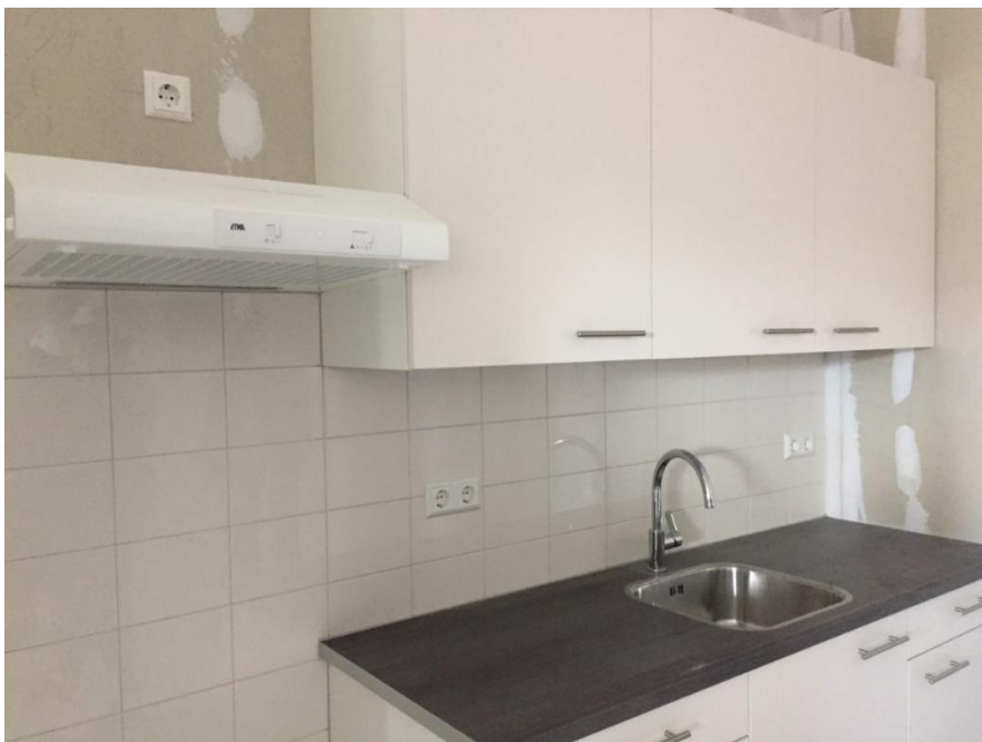
Naast het keukenblok is ruimte voor een kooktoestel of koelkast met kookplaat

Later Zodra de gronduitruil met de gemeente rond is, komen er ondergrondse containers. Hiervoor heb je een pasje nodig dat wij bij je in de brievenbus doen. Als je de pas verliest, moet je zelf een nieuwe pas aanvragen bij de gemeente.