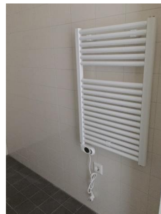
Radiator in de badkamer

Vloerbedekking bij de vloerverwarming Bij vloerverwarming kies je als vloerbedekking voor PVC, vinyl of linoleum. Het is verstandig om de betonvloer eerst te controleren op ongelijkmatigheden (bobbels en putten). Egaliseer die met een gipsgebonden egalisatieproduct. Ook katoenen, wollen en nylon tapijten zijn geschikt. Vloerbedekking mag niet dikker zijn dan 10 millimeter. Je kunt de vloer ook schilderen.