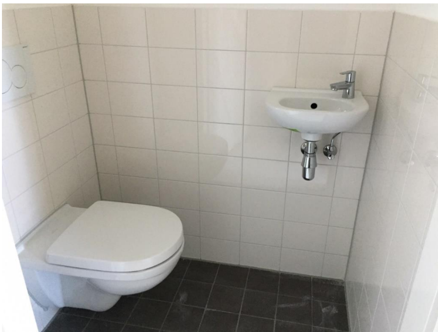
Toilet met fonteintje

Mijn Portaal: je kunt een account aanmaken op www.portaal.nl/mijnportaal zodat je toegang hebt tot je eigen gegevens. Via Mijn Portaal kun je reparatieverzoeken doen en in sommige gevallen ook zelf inplannen.