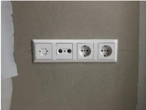
Figuur 5 Woonkamer

In je woning is een glasvezelaansluiting en een aansluiting kabelinstallatie aanwezig. Beiden bevinden zich in de bergruimte van je woning. Er is bedrading naar aansluitpunten in de woonkamer en hoofdslaapkamer. In de woonkamer zijn ze afgemonteerd aan een aansluitpunt glasvezel (KPN) en kabel (ZIGGO). In de hoofdslaapkamer zijn ze niet afgemonteerd.