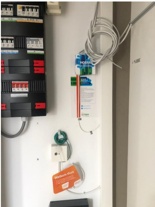
In je berging: electragroepen, montage glasvezel en kabel

Kabel ZIGGO is verantwoordelijk voor de aanleg en beheer van de kabelinstallatie naar en in je woning (tot het aansluitpunt in de bergruimte). Je sluit zelf een abonnement af bij ZIGGO.