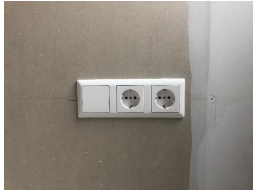
Figuur 6 Hoofdslaapkamer

Glasvezel KPN NetwerKNL is verantwoordelijk voor de aanleg en het beheer van het glasvezelnetwerk naar en in je woning (tot het aansluitpunt in de bergruimte). Het is een open netwerk, dit betekent dat je vrij bent in uw keuze van een provider. Je sluit zelf een abonnement af.